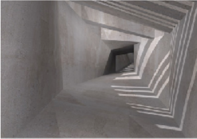
^ Licht und Schatten in einer Betonstruktur