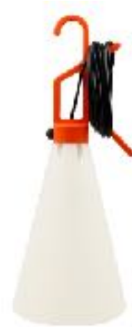
Vielseitigkeit: Leuchte "May Day" von Konstantin Grcic/FLOS ^