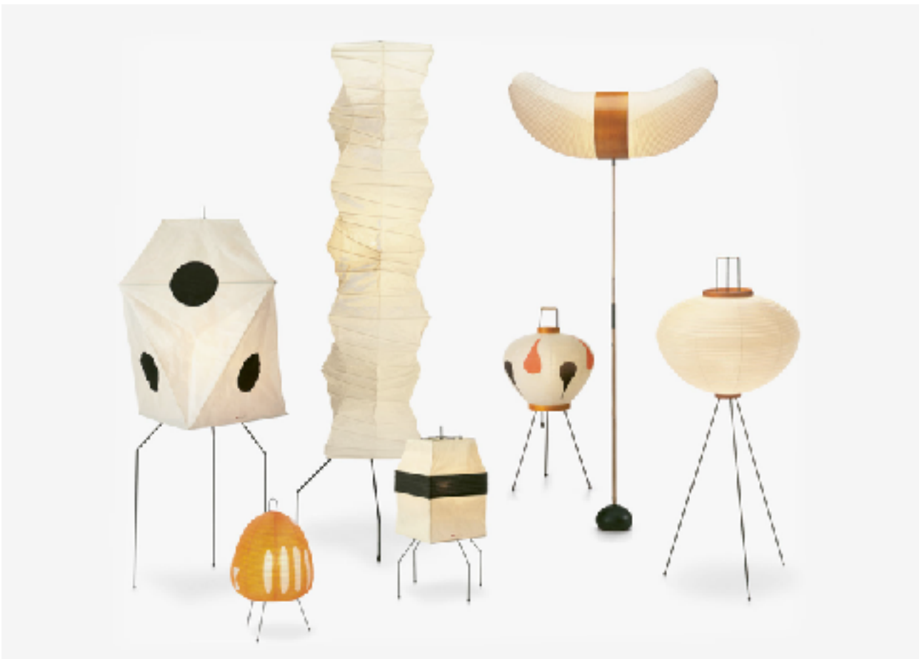
^ Papierleuchten, Isamu Noguchi, 1951

^ Leitprinzip: Entwicklung des Designs im Wechselspiel von Lichteffect, Materialbearbeitung und spezifischer Anwendung