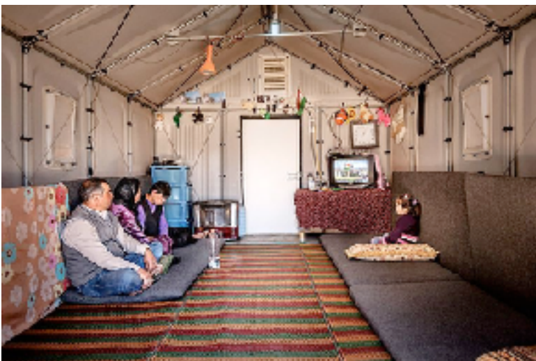
< nomadisches Leben: mit gezieltem Einsatz von Licht die räumliche Atmosphäre gestalten

Entwicklung und Produktion einer Leuchte, ausgehend von einer experimentellen Auseinandersetzung mit den spezifischen Möglichkeiten digitaler Materialbearbeitung. Untersuchung der Wechselwirkung zwischen konstruktivem Aufbau, Lichtwirkung und Typologie. Annäherung und Definition eines Anwendungsszenarios, entsprechende Detaillierung. Ausstellung und Präsentation im Rahmen der Typo2-Ausstellung, mit einerschaulichen Dokumentation des Prozesses.